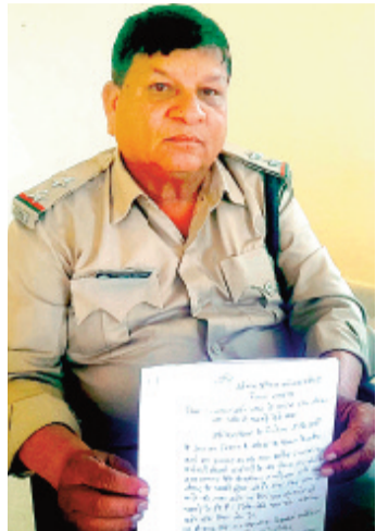
संचालक अफसरों पर हावी होते हुए उडनदस्ते गला काटने तक की धमकी दे रहे हैं।

वन विभाग के स्पेशल उडनदस्ते द्वारा इन दिनों जिले के कई स्थानों पर पेड़ों की अवैध कटाई करने वालों सहित आरामशीन संचालकों पर लगातार कार्रवाई की जा रही है। इन कार्रवाई से बौखलाए कुछ आरामशीन संचालक और उनके हुएं लोगों ने उडनदस्ते में शामिल डिप्टी रेंजर जान से मारने एवं गुप्तगं काटने की धमकी दी है।