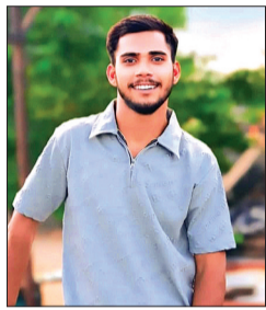
हरिभूमि न्यूज | सीहोर

पुलिस को पीएम रिपोर्ट का इंतजार, सीसीटीवी फुटेज भी खंगाले जा रहे